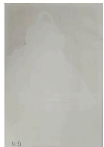
9 糊 雲母